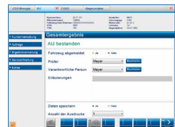
Klare Darstellung der Ergebnisse