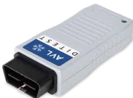
AVL DITEST OBD 1000