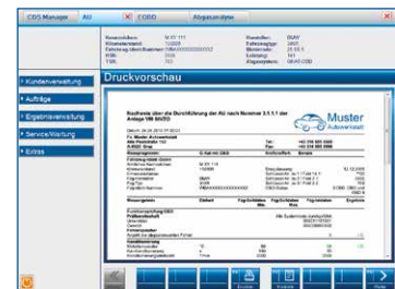
Ergebnisprotokoll für Kundenbindung mit Firmenlogo